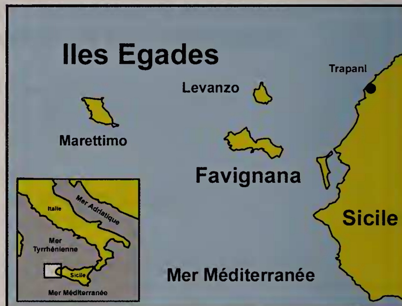
Figure 2. Archipel des Egades - Nord-ouest de la Sicile.

Nous tenons à remercier Roland Houart (collaborateur scientifique à l'Institut royal des Sciences naturelles de Belgique) pour les commentaires et la relecture de la publication.